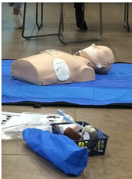
En mun-mot-mun-docka, androgynt designad eftersom man är sexuellt progressiv på civiltjänstcentralen

I vilket fall som helst har den finska staten konstruerat en fristad för civiltjänstgörare i Lappträsk år 1997. Civiltjänstgörare är dock ovanliga (ungefär 2500 personer antas till fristaden varje år), och dessutom också lite mystiska.