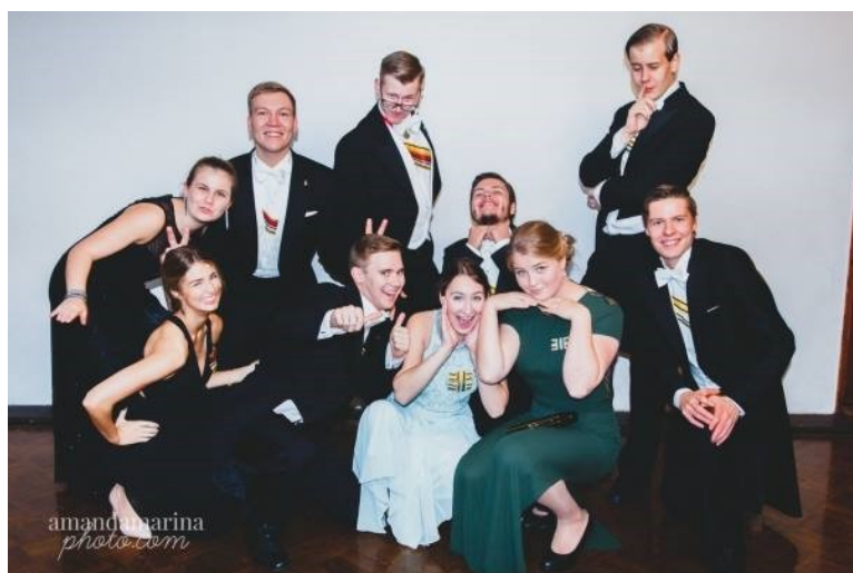
Så här glada var en del av SF's och KK's stysse17 på förra årets fest!

Trots att det är årsfest så brukar oftast alla former av propert uppförande lämnas direkt vid ingången men vi med erfarenhet av att jobba på naharen vill ändå påpeka att alla vanliga regler fortfarande gäller.