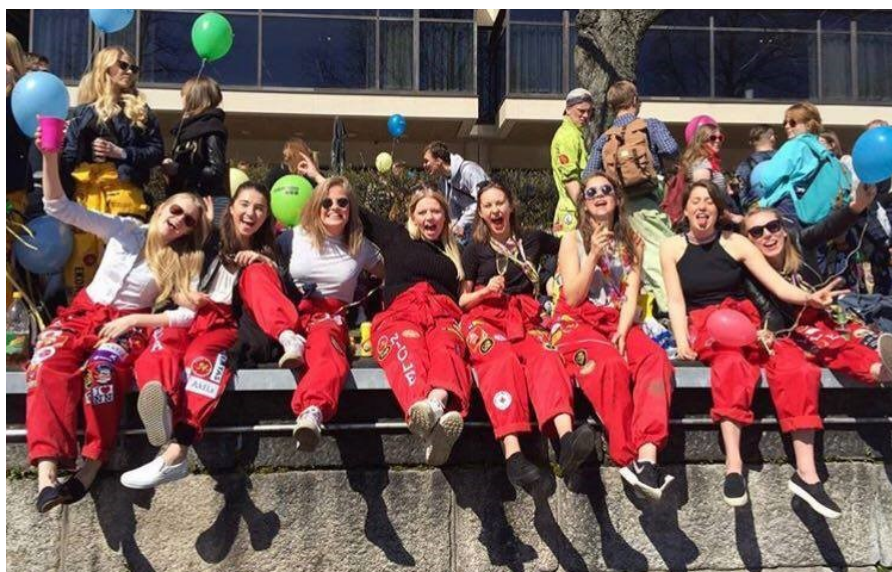
En bild från 2016, då vi ännu var fräscha, unga och glada