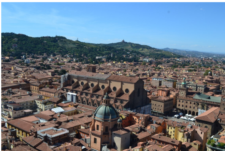
Bologna från det 97 meter höga tornet

Här är ett par bilder från resan, bilderna är tyvärr svartvita eftersom våra två chefredaktörer använt en stor del av tidningens budget på heroin.