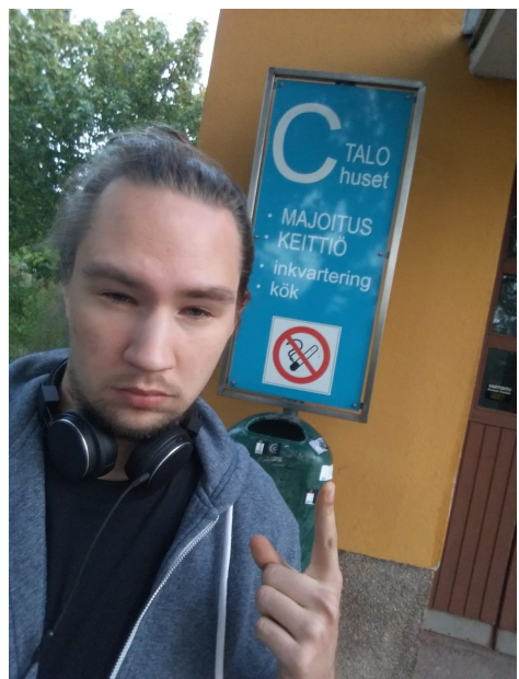
Drömmen om C-papper

Återigen ville jag skriva en cynisk och bitter artikel, men så blev det förjävlig feelgood-skit igen. Satan.