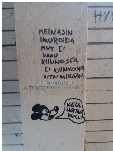
En civiltjänstgörare tillämpar klotternätverket för att få hjälp med sin apati

Den icke-konfronterande livsstilen skapar dock en väldigt fredlig stämning i Lappträsk, eftersom ingen utmanar någon annans åsikt direkt. Ingen yttrar ens sin åsikt högt, så det finns inget att debattera. Istället väljer sivare ofta att förmedla sina starka politiska åsikter via toalettgraffiti, eftersom man på det viset kan presentera sitt budskap då individen är som minst förberedd (man blir ju bokstavligen ertappad med byxorna nere), och dessutom kan man inte spåras eller konfronteras. Sivare har alltså utvecklat ett sorts underground-debattforum som möjliggör åsiktsfrihet och politiskt engagemang samtidigt som freden bevaras vid matbordet. Man kan fråga sig varför FN:s fredsbevarande styrkor innefattar militärenheter, och inte enbart består av civiltjänstgörare som kan introducera graffitidebatt till Palestina, Ukraina, ÅA:s jämställdhetskommitté och andra krisområden. Tyvärr verkar vår försvarsminister inte vara beredd att se civiltjänst som nåt positivt och presentera idén om en sivare-indsatsstyrka.